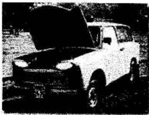
Уникалните “дръпнати” фарове на “китайката”

С възвръщането на уникалната технология “Номерът на китайката” е помислено и за желанието на китайците населението да намалява – вратите често се отварят автоматично по време на движение, за да може някой от пъпняците да изпадне удобно на пътя.